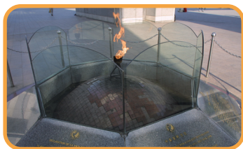
2 평화의 성화 World Peace Flame

세계평화의 문은 지하 1층, 지상 2층 규모의 건축물로, 서울올림픽 대회를 기념하기 위해 건립된 대표 기념 조형물입니다. 건축가 김종업 선생님께서 설계한 작품으로, 세 차례의 설계 변경을 거치는 우여곡절 끝에 대한민국의 전통적인 문(門) 개념을 도입하여 전통건축과 현대건축의 조화를 이루며 완성했습니다.