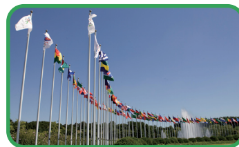
4 국가개양대 National Flags Plaza

서울의 만남은 국제올림픽위원회와 서울 올림픽조직위원회가 공동으로 제작한 작품으로, 동·서 화합을 상징하는 중앙본체와 그 주변에 오름을 상징하는 5개의 구체로 구성되어 있습니다. 또한, 당시 참가한 각국 선수단이 가져온 4,000여개의 돌로 기반을 만든 것이 특징입니다.