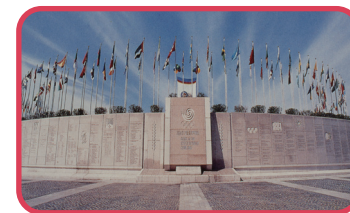
5 영광의 벽 Wall of Glory

평화의 광장에는 서울올림픽 대회 당시 16개국 중 최대 규모인 160개국 나라들의 국기가 개양대에 걸려있습니다. 이 국가개양대는 서울올림픽 대회의 현장성과 역사적 의의를 기리기 위해 설치되었습니다.