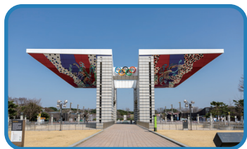
1 세계평화의 문 World Peace Gate

세계평화의 문은 지하 1층, 지상 2층 규모의 건축물로, 서울올림픽 대회를 기념하기 위해 건립된 대표 기념 조형물입니다. 건축가 김종업 선생님께서 설계한 작품으로, 세 차례의 설계 변경을 거치는 우여곡절 끝에 대한민국의 전통적인 문(門) 개념을 도입하여 전통건축과 현대건축의 조화를 이루며 완성했습니다.