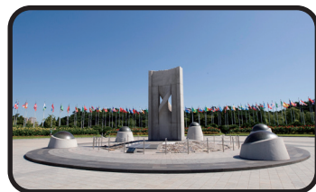
3 서울의 만남 Rendezvous in Seoul

세계평화의 문 중앙에 설치된 평화의 성화는 원형 내부 8각형의 화강석 조형물로, 서울올림픽이 세계인의 축제이자 평화의 장으로 나아가자는 의미로 제작되었습니다. 1988년 9월 12일 강화도 마니산 참성단에서 채화된 불은 1988년부터 현재까지 꺼지지 않고 올림픽공원을 지키고 있습니다.